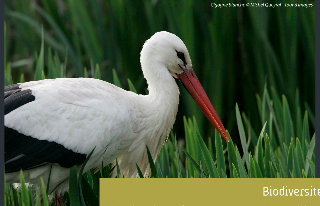
Cigogne blanche